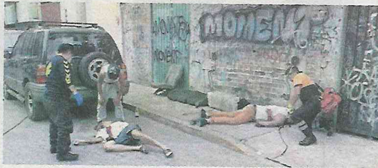
Les cortaron la borrachera

El doble crimen ocurrió la tarde de ayer en la calle Jardín Claveles y avenida Ignacio Aldama, a una cuadra del tianguis de la colonia Jardines de San Lorenzo, donde se encontraban