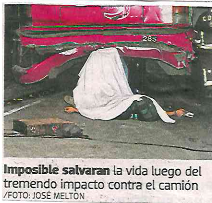
Imposible salvaran la vida luego del tremendo impacto contra el camión

Según los primeros reportes, mientras los dos sujetos transitaban por Eje 5, intentaron robar un vehículo y al no poder hacerlo perdieron el control de la moto y