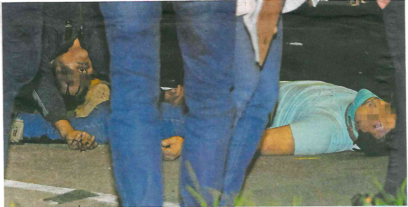
Una de las víctimas del encontronazo salió disparada

chocaron contra la parte de atrás de un camión de la Ruta 25.