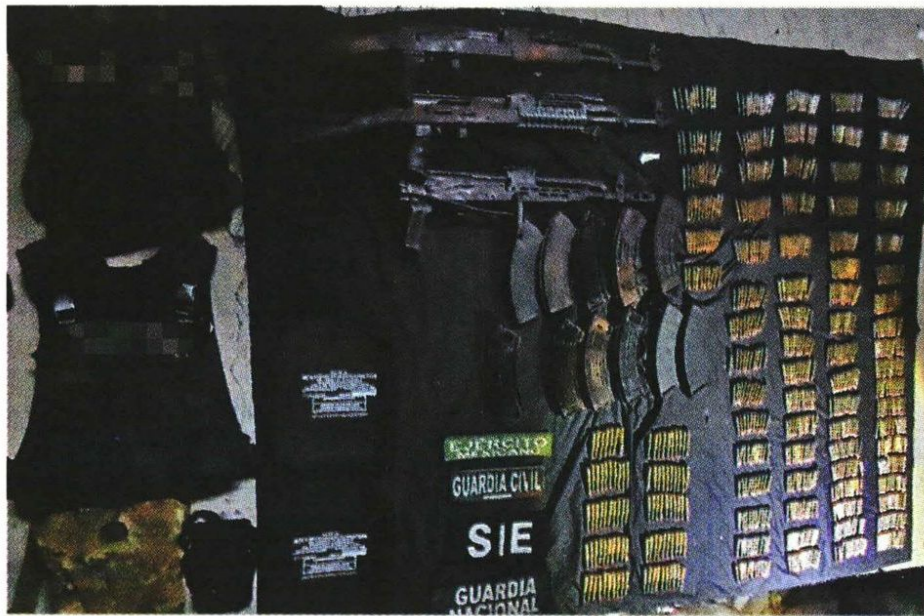
Armamento asegurado en Michoacán. ESPECIAL