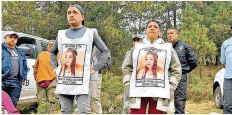
Se desplegaron más de 30 servidores públicos de distintas dependencias para realizar un barrido en la zona