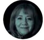
ROSARIO PIEDRA IBARRA