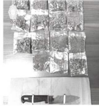
Sucedió en calles de Tlalpan

Finalmente, el imputado fue detenido y presentado junto con lo asegurado, ante el agente del MP correspondiente, quien determinará su situación jurídica.