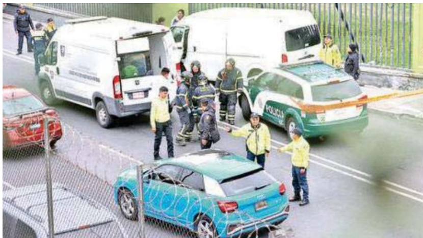
Los primeros informes señalan que el conductor de la camioneta perdió el control para impactarse contra un poste

En el informe de los policías señalan que al prestar la ayuda a la mujer ya no contaba con signos vitales, es por ello que se llamó a los Servicios Periciales, que envían a personal para el procesamiento del lugar