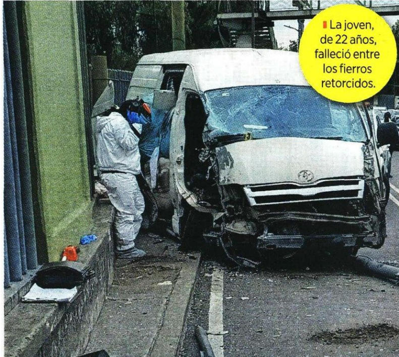
La joven, de 22 años, falleció entre los fierros retorcidos.

El tránsito se alentó hasta la Avenida Central, a la altura del Metro Nezahualcóyotl, según reportes.