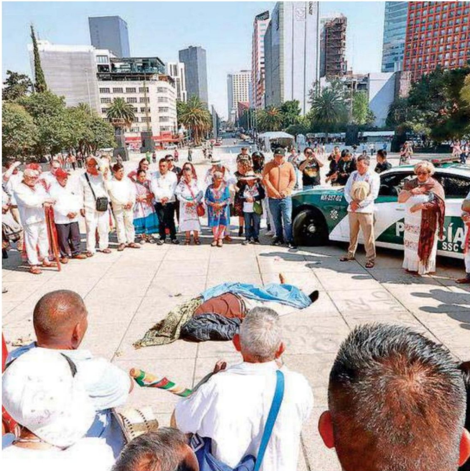
Una vez confirmado el deceso del hombre los miembros del consejo indígena iniciaron un ritual alrededor del cadáver a fin de despedir los restos mortales