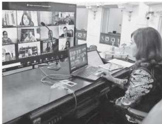
Congresistas demandan participación de la SSC y Semovi en beneficio de conductores

En su calidad de congresista promoviente hizo notar que la tasa de motorización es actualmente del 4 por ciento anual, lo que representa aproximadamente un aumento de 200 mil vehículos cada año. Fundamentó que el 85% de la infraestructura vial de la Ciudad de México es utilizada por automóviles y sólo el 15 por ciento se usa por el transporte público, aunque los vehículos particulares sólo satisfacen el 30 por ciento de los viajes totales.