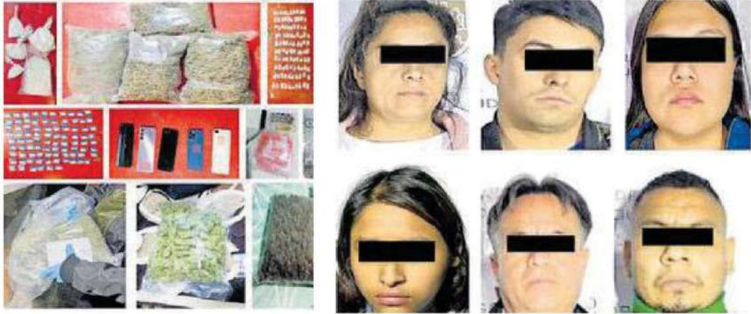
Fueron detenidas tres mujeres y tres hombres y les aseguraron aparente droga y cinco teléfonos celulares