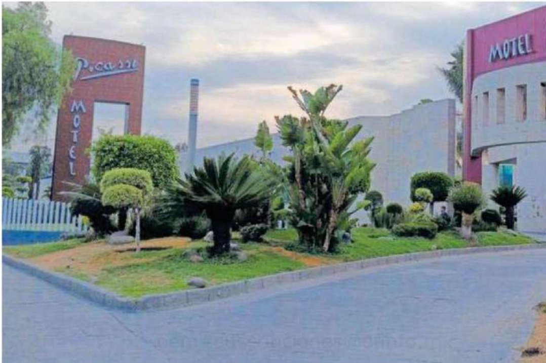
Tras las acusaciones contra las goteras, varias víctimas han expuesto su modus operandi y los lugares a los que acuden