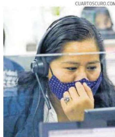
Personal capacitado las atiende.

Dijo que se tramitaron medidas de carácter familiar", ello permitió la "recuperación inmediata" de 98 menores de edad, indicó que este año, la administración comenzó con la construcción de 200 kilómetros de senderos seguros "Camina libre, camina segura", que unan a los mil 120 que ya operan en CDMX.