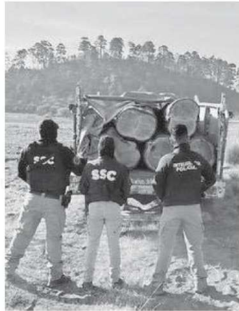
Esta fue la madera incautada