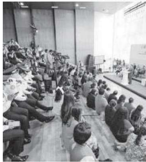
El gobierno presentó informe mensual