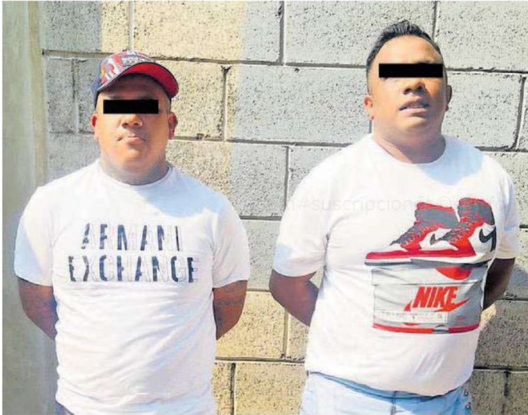
A la hora de su captura se les aseguraron 202 dosis de vegetal verde y seco con las características de la marihuana, una mochila y 900 pesos en efectivo