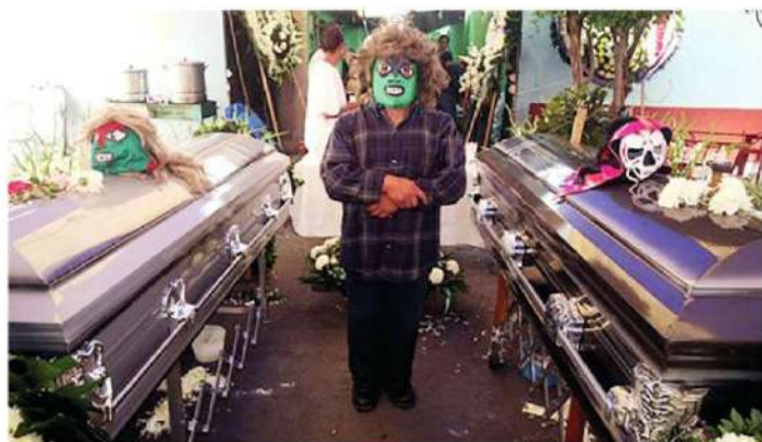
La Parkita y Espectrito fueron víctimas de las malvadas Goteras