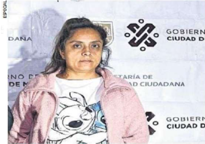
La Señora o La Patrona cuenta con antecedentes por delitos contra la salud y posesión de arma de fuego de uso exclusivo del Ejército.