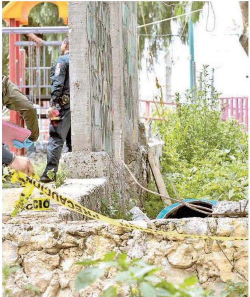
Restos de una mujer abandonados en una bolsa negra de basura dentro de un bote fueron encontrados en un parque infantil en Iztapalapa

Fueron varias horas que peritos de la Fiscalía General de Justicia de la Ciudad de México (FGJCDMX) realizaban las investigaciones correspondientes para después ser trasladado al Servicio Médico Forense.