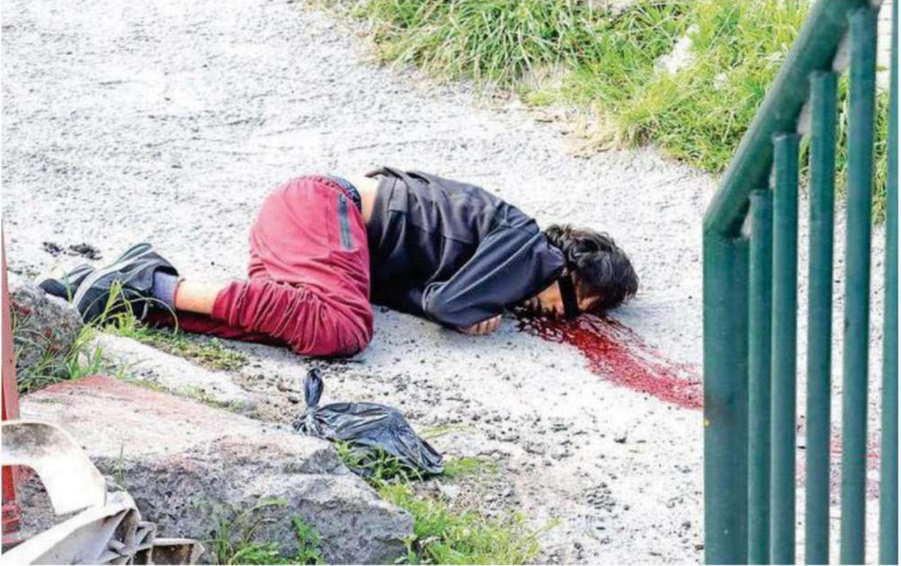
Junto al puente peatonal quedó el cuerpo del hombre