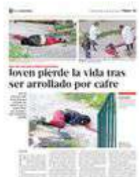
Joven pierde la vida tras ser arrollado por café