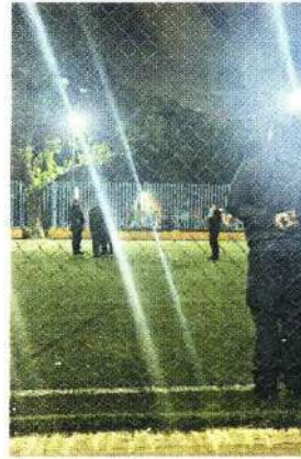
En la Colonia Álamos, Alcaldía Benito Juárez, fue el tiroteo.

Hasta anoche no había personas detenidas por los hechos de violencia.