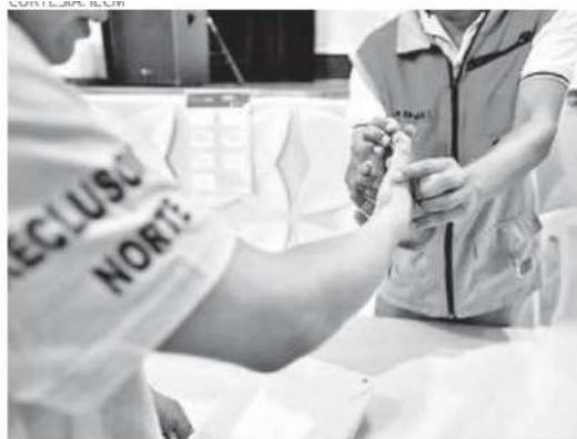
Los procesos implementados en torno al voto de personas en prisión quedaron plasmados en un libro

Lo anterior, de acuerdo con el informe final de labores de la Comisión Provisional encargada de coordinar las actividades tendientes a recabar el voto de personas que se encuentran en prisión preventiva, para el proceso electoral local ordinario 2023-2024.