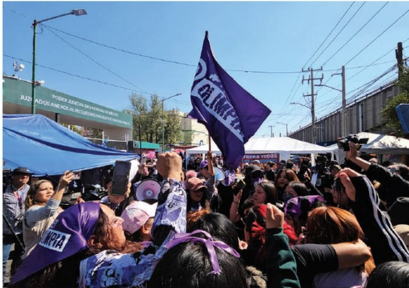
COLECTIVO en favor de Diego "N" confronta a las jóvenes que exigen una sentencia en contra del sospechoso, ayer.

“DIEGO en todo momento ha estado muy sonriente, muy tranquilo creyendo que no va ser sentenciado (...), eso más que darle seguridad a las víctimas, las ha dejado en un estado de conmoción”