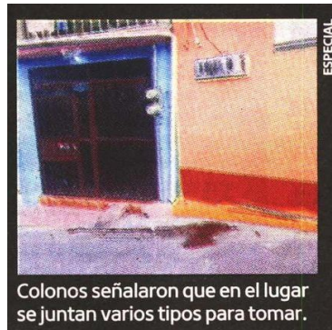
Colonos señalaron que en el lugar se juntan varios tipos para tomar.

Por medio de las fuentes policíacas se conoció la identidad del fallecido; además, se supo que el hombre cuenta con antecedentes penales por el delito de robo en su modalidad sustracción de objetos y de carácter calificado, por lo que no se trata de una blanca paloma.