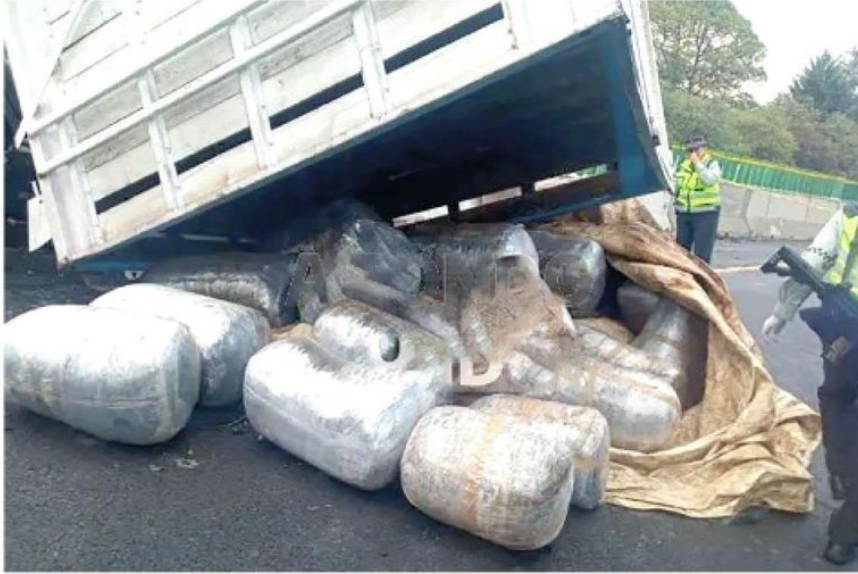
La droga quedó regada en el asfalto