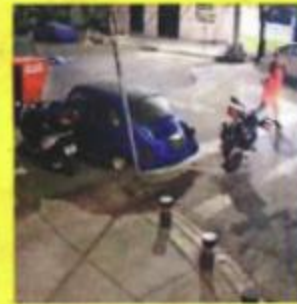
CAMARAS DE VIDEO

cionada en la zona, por lo que resultó ileso.