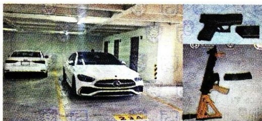
Le aseguraron drogas, armas y un auto de alta gama.

JÁQUER Él probablemente tiene cinco células delictivas dedicadas a extraer dinero en cajeros automáticos, clonación de identidad de cuentahabientes y operaciones espejo.