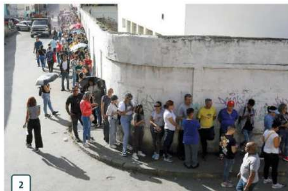
2 CIUDADANOS responden a la cita electoral con largas filas.