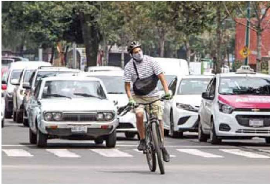
Rutas. La mayor parte de las ciclovías están en alcaldías del centro de CDMX.

Conexiones. El proyecto se encuentra en fase de revisión de factibilidad técnica; la ciclovía sería parte de un reordenamiento de Ermita Iztapalapa, advierte especialista