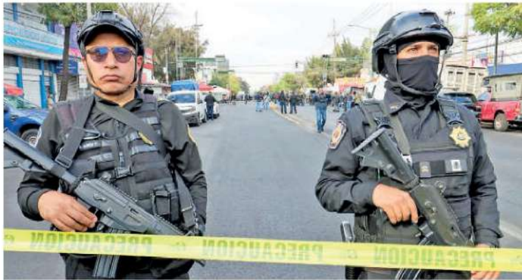
Janet "N" y Erick "N" son los 2 detenidos ligados al asesinato en el Edomex del coordinador de inteligencia capitalino Milton Morales.

La FGI-CD-MX informó que fueron capturados en calles de Ecatepec.