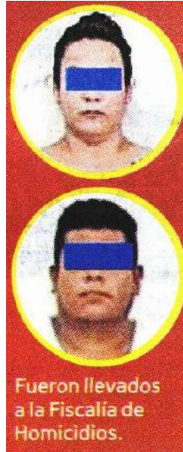
Fueron llevados a la Fiscalía de Homicidios.

Los vehículos fueron utilizados como medios para realizar actos de vigilancia previa en las inmediaciones del domicilio de la víctima y les fueron colocados medios de identificación diversos para esos fines, los cuales guardan relación con Lorena Janeth "N" y Erick Gerardo "N", establecieron los peritajes.