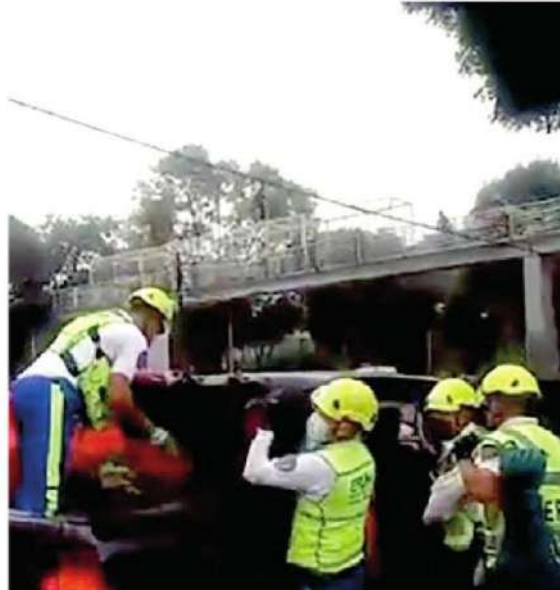
Lograron salvar al suicida

Por último, el cuerpo de paramédicos lo diagnosticó con una fuerte crisis de ansiedad, sin embargo, no requirió traslado hospitalario. Posteriormente fue trasladado al Ministerio Público.