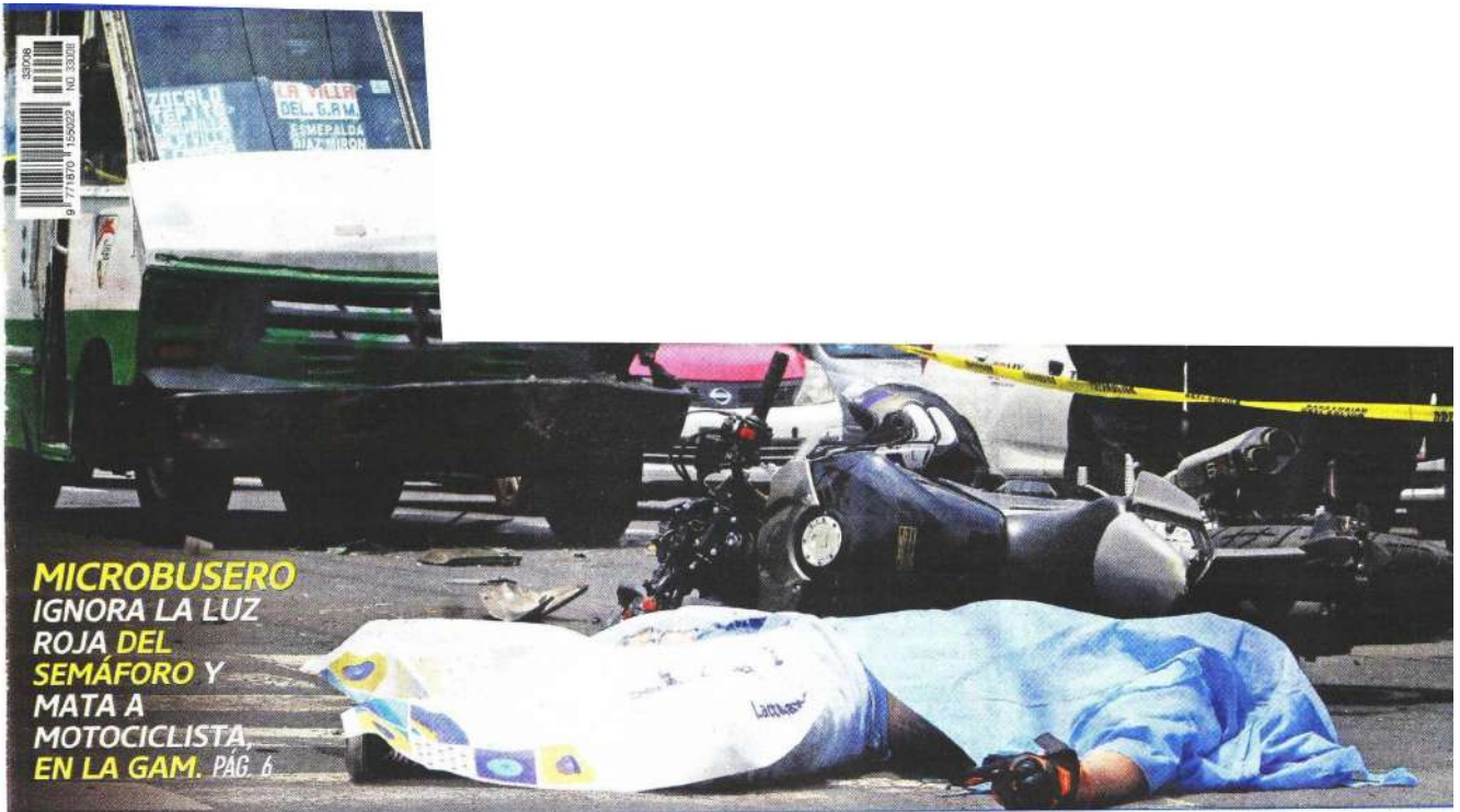
MICROBUSERO IGNORA LA LUZ ROJA DEL SEMÁFORO Y MATA A MOTOCICLISTA, EN LA GAM. PÁG. 6