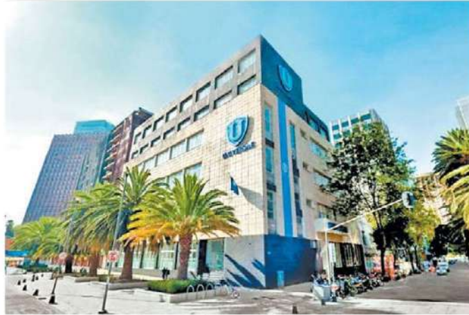
Fachada del plantel en Ciudad de México