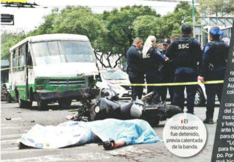
El microbusero fue detenido, previa calentada de la banda.