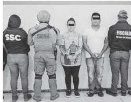
Tramitaron placas del auto de huida