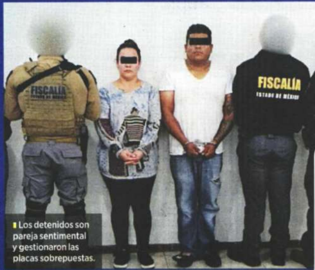
Los detenidos son pareja sentimental y gestionaron las placas sobrepuestas.

La identificación de las placas usadas en los automóviles permitió detectar que estaban sobrepuestas. Ese fue el hilo que llevó a los detenidos y que podría llevar a los demás implicados, pues aseguraron dos celulares y se presume que uno de ellos podría contener indicios.