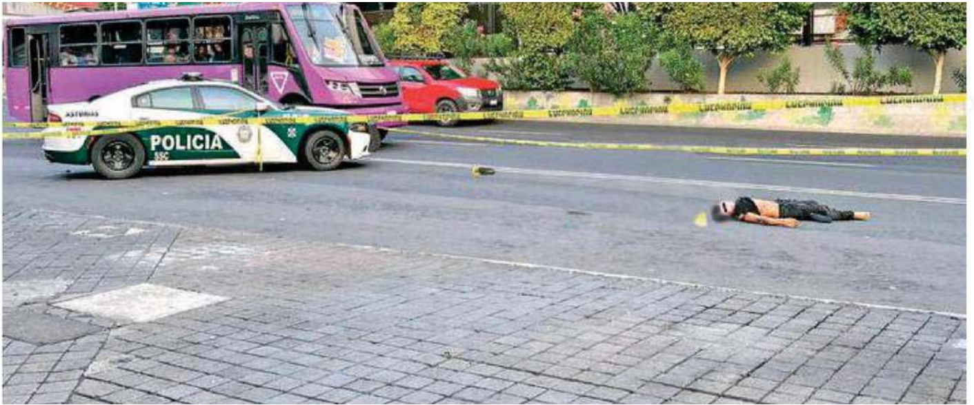
El occiso de entre 25 y 30 años de edad, quedó sobre la cinta asfáltica de los carriles laterales