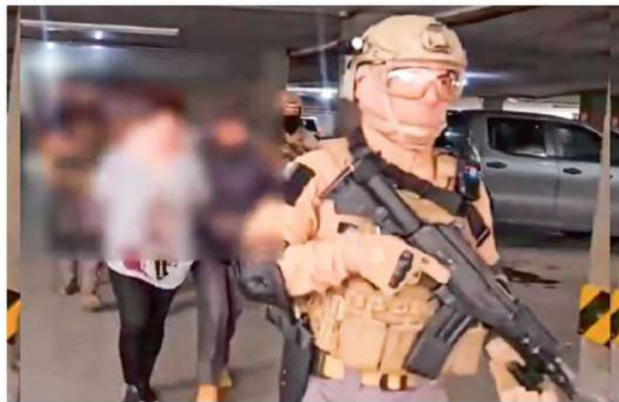
ASEGURADOS. La pareja fue detenida en Ecatepec, tras ser identificada como la que tramitó las placas del auto donde viajaban los presuntos asesinos.

A los detenidos se les aseguró telefonía celular e investigan los archivos con indicios que podrían establecer la identidad de otros implicados en el homicidio de Morales Figueroa.