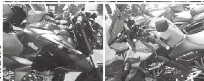
Terminaron presos por chistocitos