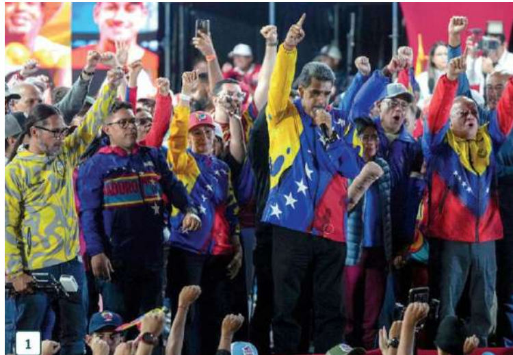
1 NICOLÁS MADURO celebra en Caracas su segunda reelección.

Ciudadanos abarrotan centros de votación dentro y fuera del país, mientras simpatizantes del régimen vigilan las calles para hacer valer el triunfo de su líder.