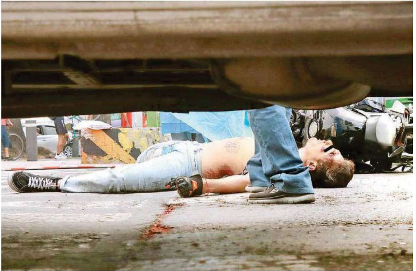
Paramédicos al revisar al motociclista confirmaron que ya no contaba con signos vitales, por lo que fue cubierto con una sábana azul para que no lo vieran los curiosos o siguieran tomando fotos