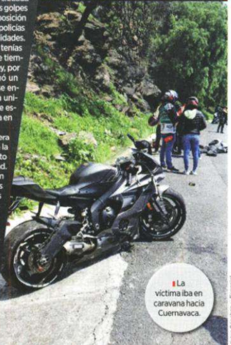
La víctima iba en caravana hacia Cuernavaca.