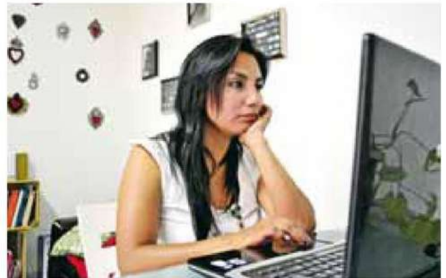
Auge. Venta de terrenos, mercancías y hasta autos decomisados se ofrecen en internet.

Estos mensajes notifican a los destinatarios sobre multas ficticias y les instan a realizar pagos a través de enlaces fraudulentos que redirigen a sitios diseñados para robar información personal y financiera.