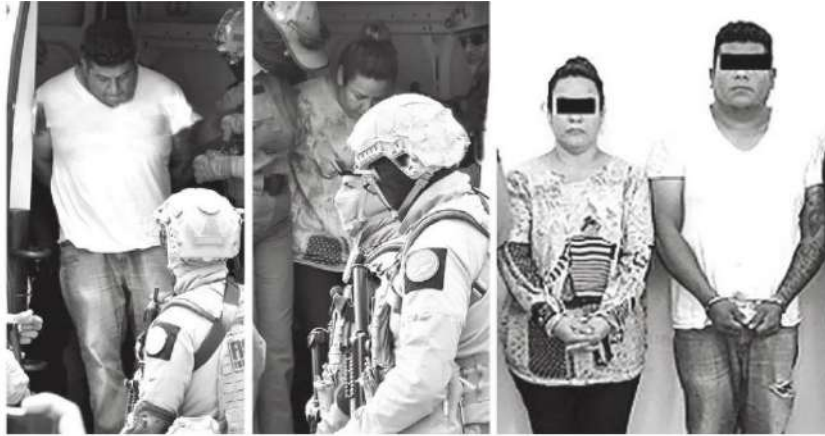
Intentaban escapar con rumbo a Zacatecas