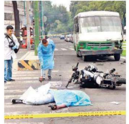
En medio del levantamiento del cuerpo, elementos de la SSC y tránsito comenzaron con agresiones a fotógrafos de diversos medios, debido a que según ellos habían pedido eso los familiares, pero cabe descartar que los familiares llegaron hasta el último y jamás solicitaron que no lo fotografieran