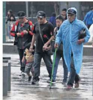
La lluvia de ayer fue de entre 15 y 29 milímetros, según autoridades.

En el primero, el agua alcanzó más de 50 centímetros de altura en la avenida Vía Real y Valle de San Pedro, así como la carretera federal México-Pachuca, en la zona del Barquito, Esmeralda, y en calles de Ojo de Agua se cayó un árbol. ●