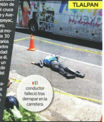
El conductor falleció tras derrapar en la carretera.