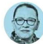
ROSA ICELA RODRÍGUEZ

► Nos cuentan que el dirigente de Movimiento Ciudadano, Dante Delgado , ya mandó recados a los priistas que se han rebelado ante la posible reelección de Alejandro Moreno como dirigente. El líder naranja se encargó de dejarles claro que en su partido están abiertas las puertas, sobre todo para el sonorense Manlio Fabio Beltrones .