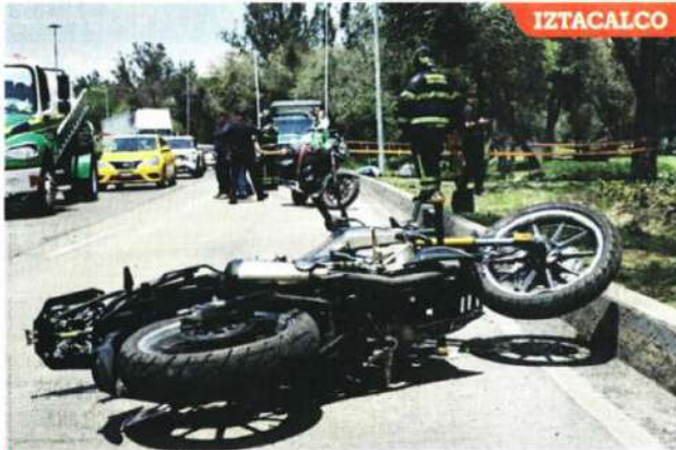
La motocicleta en la que viajaba quedó en la vialidad a varios metros de distancia.