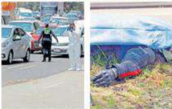
Personal de Investigación Forense y Servicios Periciales de la Fiscalía General de Justicia FGI de la Ciudad de México realizaron las diligencias correspondientes.