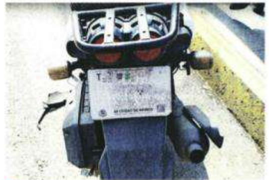
El piloto de una motoneta murió tras estrellarse con un mototaxi cuando circulaba por la carretera Mixquic-Chalco.