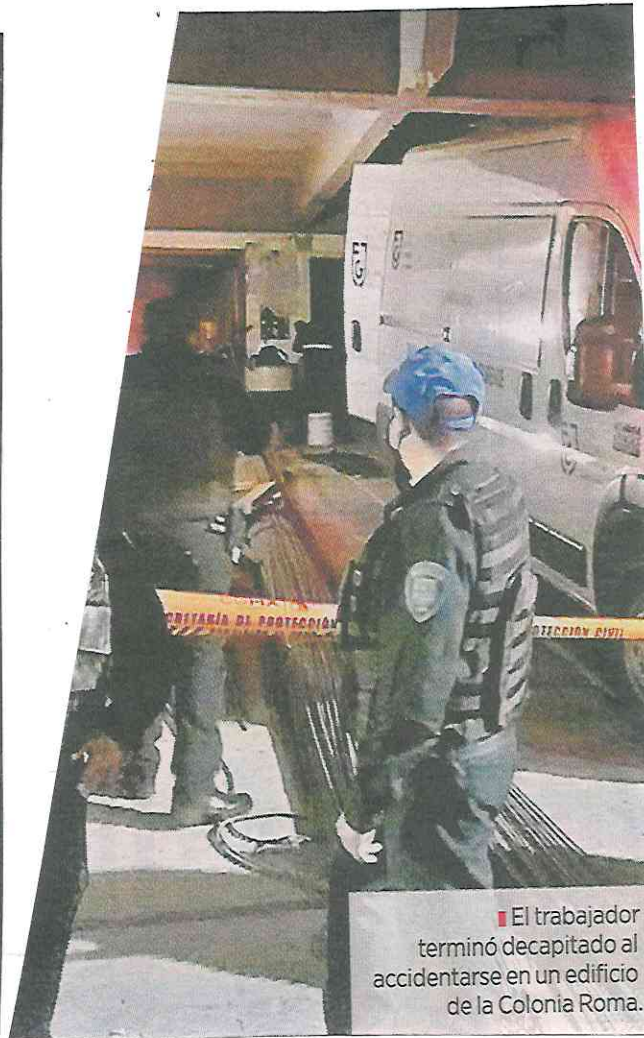
El trabajador terminó decapitado al accidentarse en un edificio de la Colonia Roma.

Durante las labores, policías de la Secretaría de Seguridad Ciudadana se mantuvieron en el sitio, donde el trabajador fue reconocido por uno de sus primos.