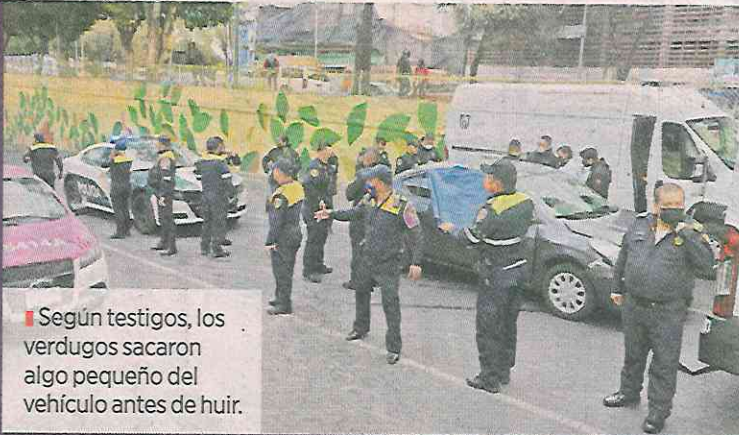
■ Según testigos, los verdugos sacaron algo pequeño del vehículo antes de huir.

“Luego rodeó el vehículo por la parte posterior y sacó algo pequeño del interior del vehículo, sin lograr distinguir lo que era”,