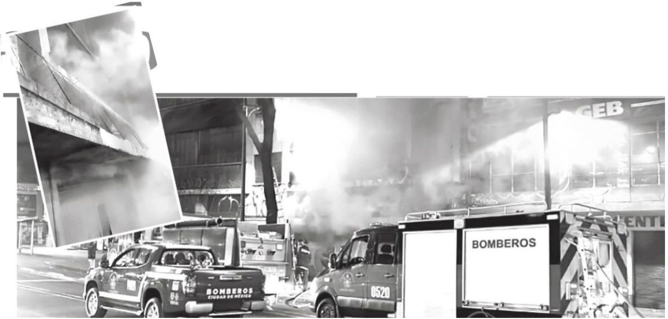
Los vulcanos laboraron arduamente para sofocar el fuego