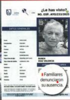
Familiares denunciaron su ausencia.