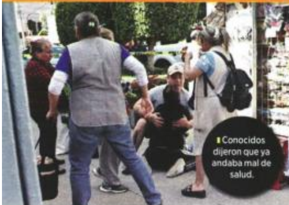
Conocidos dijeron que ya andaba mal de salud.