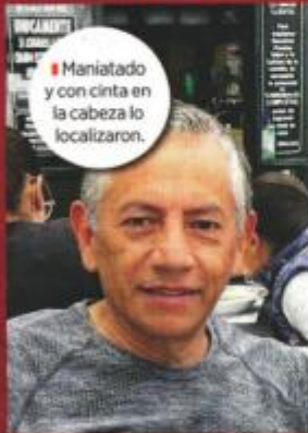
Maniatado y con cinta en la cabeza lo localizaron.

De acuerdo con sus familiares, más tarde intentaron contactarlo por celular pues habían planeado reunirse