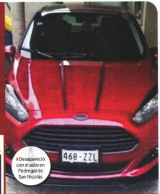
Desapareció con el auto en Pedregal de San Nicolás.

Tiene complexión delgada, tez morena clara, cabello cano, estatura aproximada de 1.60 metros. Viste sudadera gris, pantalón de mezclilla y tenis blancos. Se encuentra maniatado y también tiene la cabeza encintada.