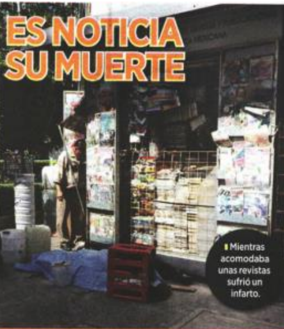
Mientras acomodaba unas revistas sufrió un infarto.