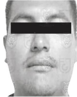
Poco le duró el gusto