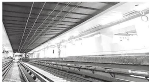
· La Guardia Nacional se sumó para evitarlo

· El problema se registró principalmente en las Líneas, 2, 3, 5, A, B y 12 del Metro