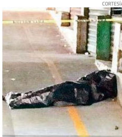
Autoridades indicaron que el occiso era de situación prioritaria

Autoridades indican que en época de frío es cuando más personas en situación prioritaria pierden la vida, debido a que no tienen un hogar y solo se cubren con cartones o papel periódico.