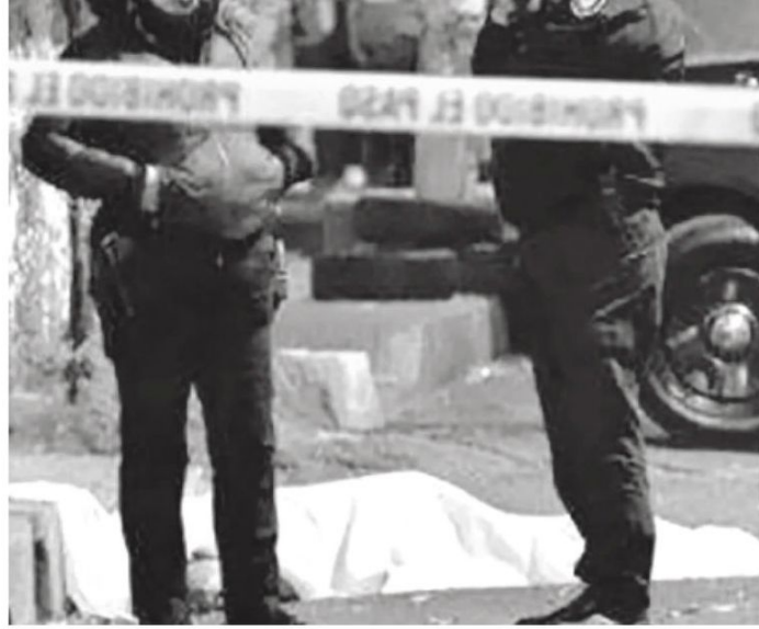
Se presume que se trató de un crimen pasional